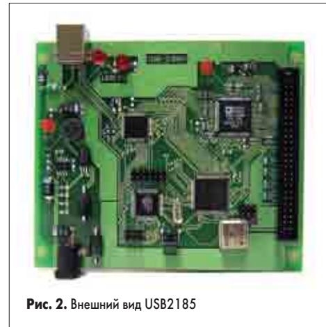
Рис. 2. Внешний вид USB2185

В качестве реализованного на практике примера этой схемы можно привести созданное авторами универсальное интерфейсное устройство USB2185 (рис. 2).